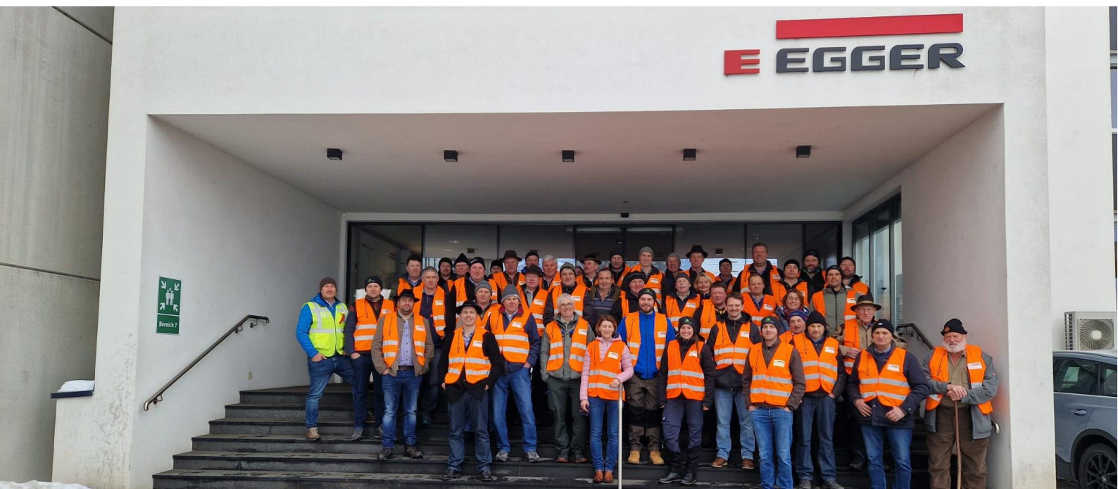
Lehrfahrt im Januar 2026 zur Firma Egger in St. Johann, Tirol